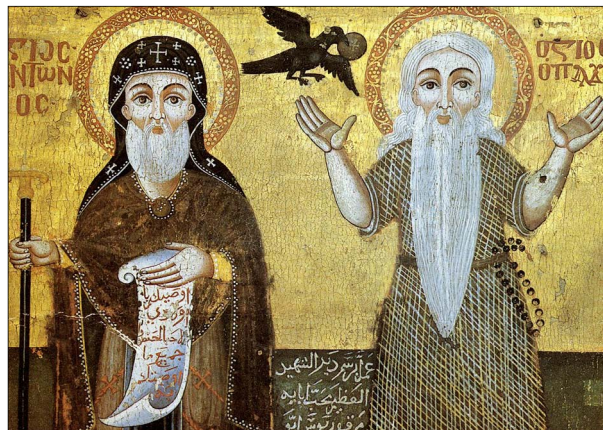
Saint Paul de Thèbes et saint Antoine (musée copte du Caire)

Les Pères du désert sont des gens simples qui, entre le II e et le VII e siècle, se sont lancés dans les fournaies des déserts d'Égypte avec pour seules étoiles l'amour du Christ dans le cœur et les textes de la Bible dans les mains. Cet élan qui s'amorce avec Antoine le Grand, le père de tous les moines, a essaimé d'Alexandrie à Thèbes, produisant